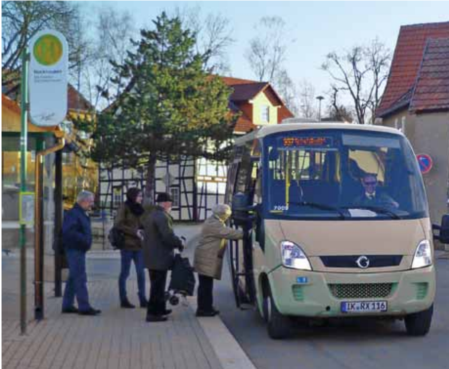
Bitte einsteigen, von Rockhausen nach Erfurt mit der RBA-Linie 357

► Seit dem 31.10.2010 verbindet die RBA-Linie 357 Gemeinden des nördlichen Ilm-Kreises mit der Landeshauptstadt Erfurt.