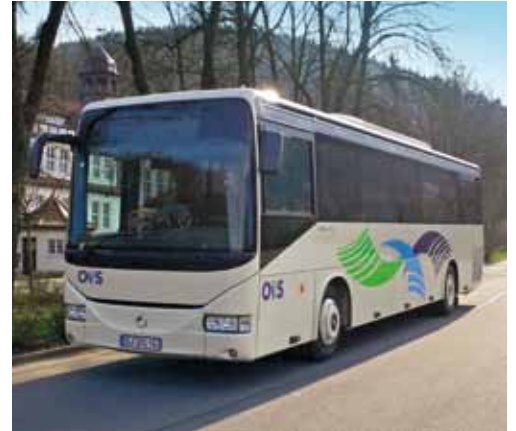
Der Standardlinienbus ist im ländlichen Raum unverzichtbar.