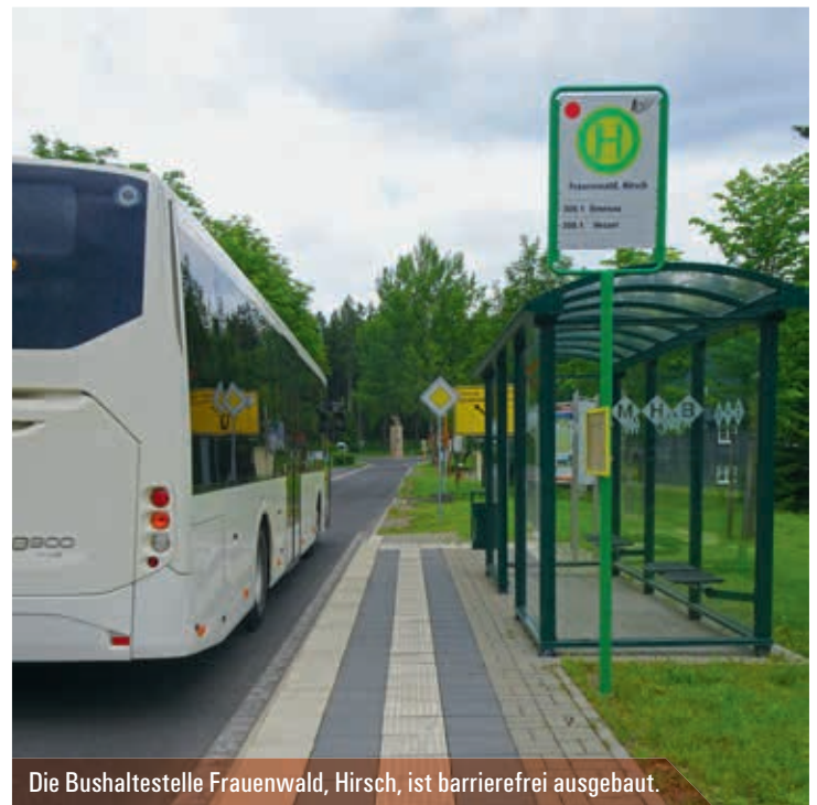
Die Bushaltestelle Frauenwald, Hirsch, ist barrierefrei ausgebaut.

» Barrierefreie Haltestellen müssen der anzuwendenden DIN entsprechen. «