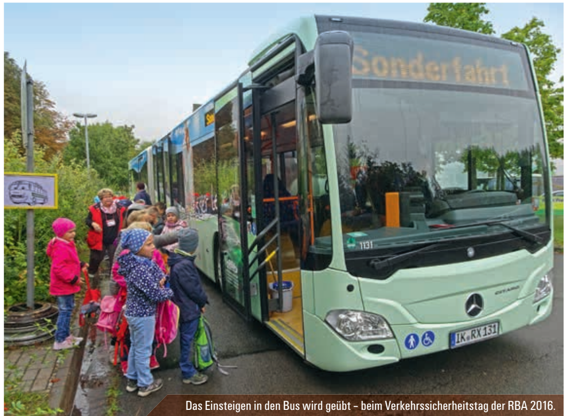
Das Einsteigen in den Bus wird geübt – beim Verkehrssicherheitstag der RBA 2016.

Die RBA ist gut auf den ersten Schultag und die Schüler vorbereitet. Die Mitarbeiter werden extra geschult und eingewiesen, wie sie mit ihren jungen Kunden umgehen sollen, wenn nötig, sie auf allgemeine Umgangsformen hinzuweisen. Die