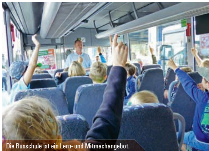
Die Busschule ist ein Lern- und Mitmachangebot.

Regelmäßig laden Verkehrsunternehmen Schulklassen zu Verkehrssicherheitstagen oder ähnlichen Veranstaltungen ein. Beteiligt sind Verkehrswachten, Polizei, Feuerwehr und weitere Partner, die Verantwortung für einen sicheren Schulweg über-