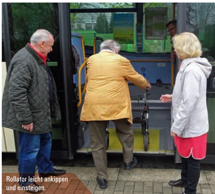
Rollator leicht ankippen und einsteigen.